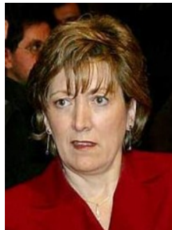
María Jesús Sansegundo

Ministerin für Bildung und Wissenschaft Minister of Education and Science Ministre de l'Éducation et de la Science