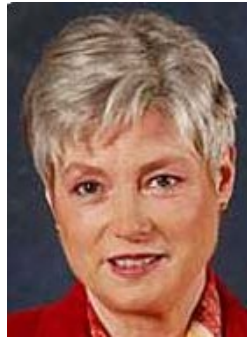
Maria J.A. van der Hoeven

Ministerin für Bildung, Kultur und Wissenschaft Minister of Education, Culture and Science Ministre de l'Éducation, de la Culture et de la Science