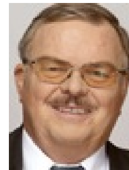
Hans Ulrich Stöckling

Minister für Bildung Minister of Education Ministre de l'Éducation