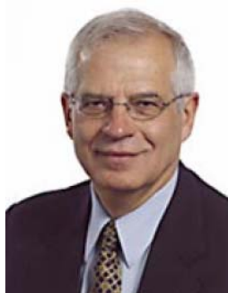
Josep BORRELL FONTELLES