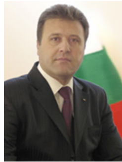
Nihat Tahir Kabil

Minister für Land- und Forstwirtschaft Minister of Agriculture and Forestry Ministre de l'Agriculture et des Forêts