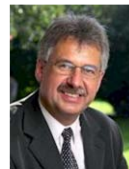
Hans Christian Schmidt

Minister für Ernährung, Landwirtschaft und Fischerei Minister for Food, Agriculture and Fisheries Ministre de l'Alimentation, de l'Agriculture et de la Pêche