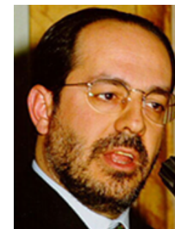
Paolo de Castro

Minister für Agrar- und Forstpolitik Minister for Agricultural and Forestry Policy Ministre des Politiques agricoles et forestières