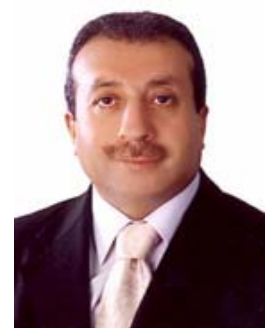
Mehmet Mehdi Eker

Minister für Landwirtschaft und Dorfangelegenheiten Minister of Agriculture and Village Affairs Ministre de l'Agriculture et des Affaires villageoises