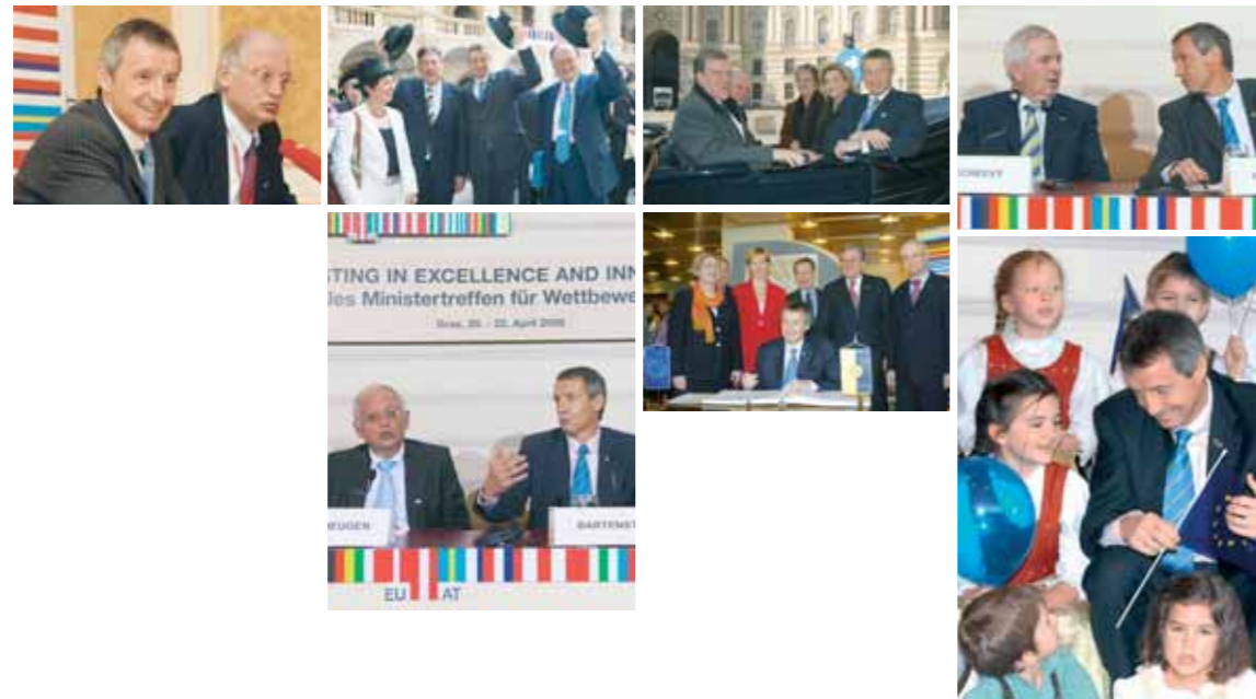
Bundesminister Dr. Martin Bartenstein