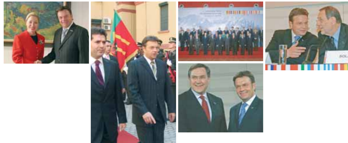
Bundesminister Günther Platter