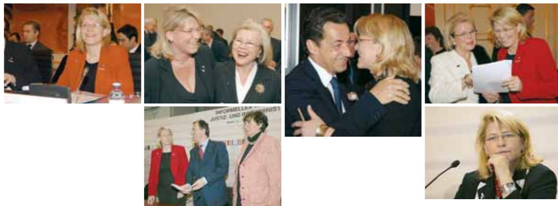
Bundesministerin Mag. Karin Gastinger