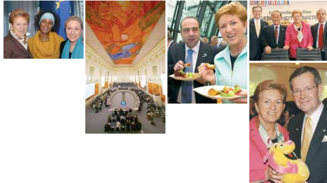
Bundesministerin Maria Rauch-Kallat