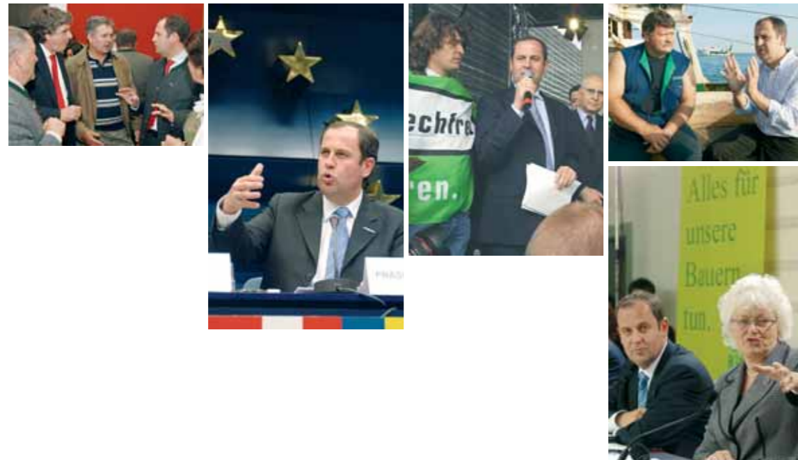
Bundesminister DI Josef Pröll