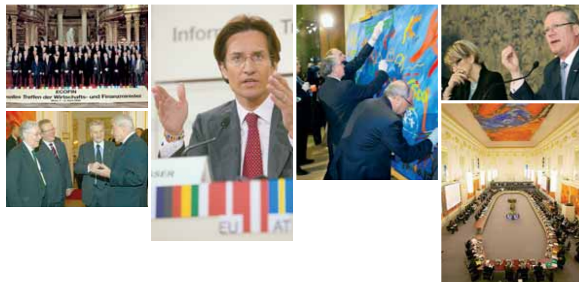
Bundesminister Mag. Karl-Heinz Grasser Staatssekretär Dr. Alfred Finz