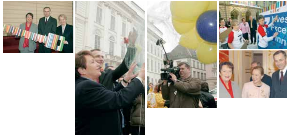
Bundesministerin Elisabeth Gehrler